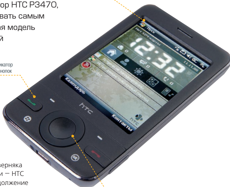
Помимо сенсорного экрана, коммуникатор оснащен панелью из механических кнопок