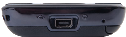
Чтобы облегчить жизнь пользователю, производитель оснастил Pharos стандартным разъемом miniUSB

Небольшой, стильный и практичный коммуникатор HTC P3470, известный также как Pharos, вряд ли можно назвать самым передовым решением. Зато это вполне доступная модель с полнофункциональной спутниковой навигацией