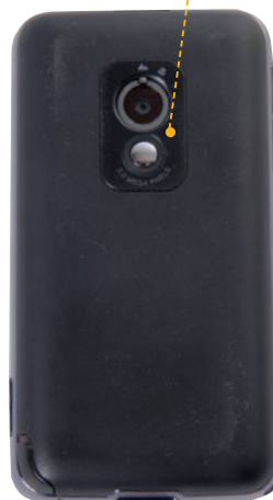
Главной особенностью 2-мегапиксельной камеры аппарата является наличие механической макрофокусировки