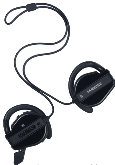
Стереогарнитура YA-BH270 доступна в двух цветовых решениях: белом и черном, а заряжать ее можно от USB-порта

Заряда батареи хватит на 6,5 часов прослушивания музыки при максимальной громкости или порядка 150 часов в режиме ожидания.